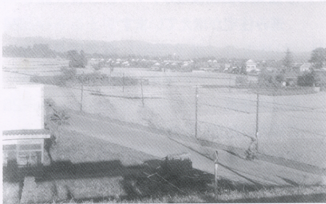
日野駅から見た八丁田んぼ （右上に水車小屋が見える 昭和 28・29 年頃）