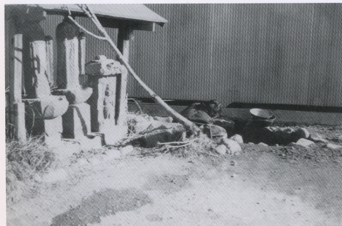
用水で洗い物（昭和初期）