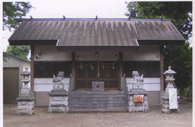
今日の日野宮神社社殿（平成 21 年）