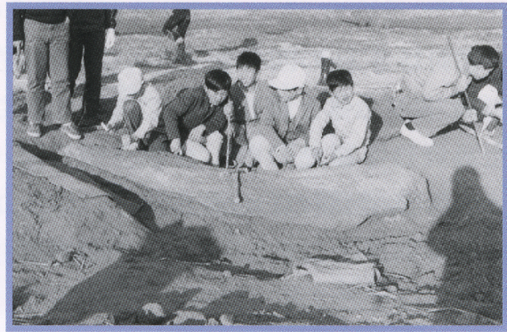
ヒノクジラの化石

なお、となりの昭島市でもほぼ完全な形でクジラの化石が発見されています。昭島で見つかったので、「アキシマクジラ」とよばれています。