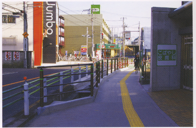
今日の日野用水（同じ地点から撮影）（平成 21 年）