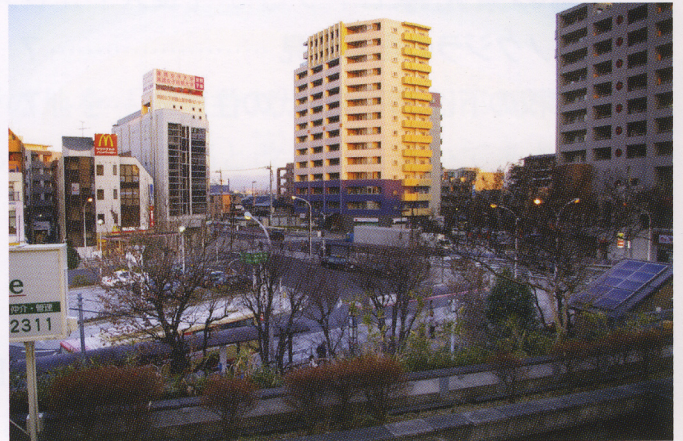
今日の日野駅からの風景（同じ地点から撮影）（平成 21 年）