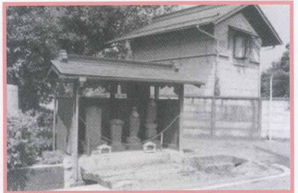
四谷の庚申塔（右2体は、お地蔵様）