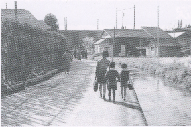
昔の日野用水（昭和 29 年）