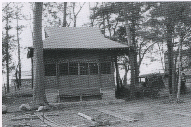
日野宮神社社殿（昭和 40 年）