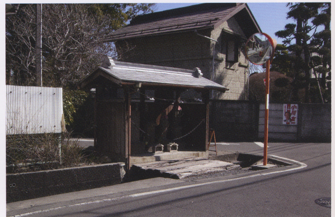
今の用水（平成 21 年）