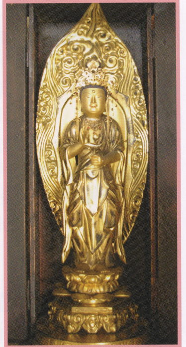
日野宮神社の仏像

この阿弥陀堂は、昭和35年にとりこわされました。そのあとに、四谷自治会館がたてられました。この自治会館も平成4年にこわされました。阿弥陀堂の3体の仏像は、日野宮神社にうつされ、今でも念仏講は日野宮神社で続けられています。このうちの1体が、うなぎ伝説と関係がある仏像で、両袖がうなぎそっくりに見えます。