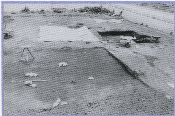
平安時代の住居跡

七ツ塚あたり一帯は、石器や土器の破片が散乱し、発掘調査によって縄文時代の住居跡が多数発見されています。