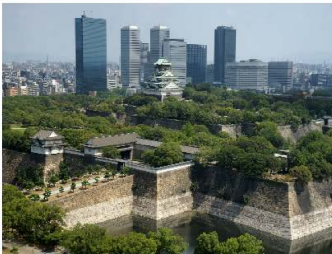
(大阪城とビジネスパーク)

~~~~~ 各都道府県の歴教協から交流会のお知らせがきています。 連絡先をお知らせしますので、それぞれの皆さま方で、担当の幹事の方に連絡をとってくだ さい。 よろしくお願いたします。