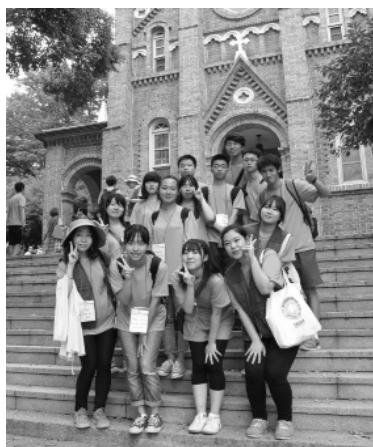
コンセリ聖堂前で（韓国）