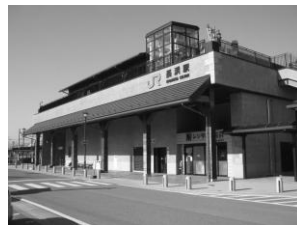
びわこ口からの長浜駅外観