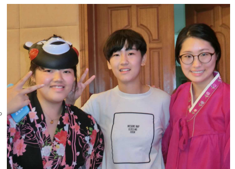
文化交流会で司会をした3国の高校生

主催団体 〔日本〕第15回東アジア青少年歴史体験キャンプ実行委員会 〔韓国〕アジアの平和と歴史教育連帯 〔中国〕中国社会科学院近代史研究所／中国社会科学文献出版社