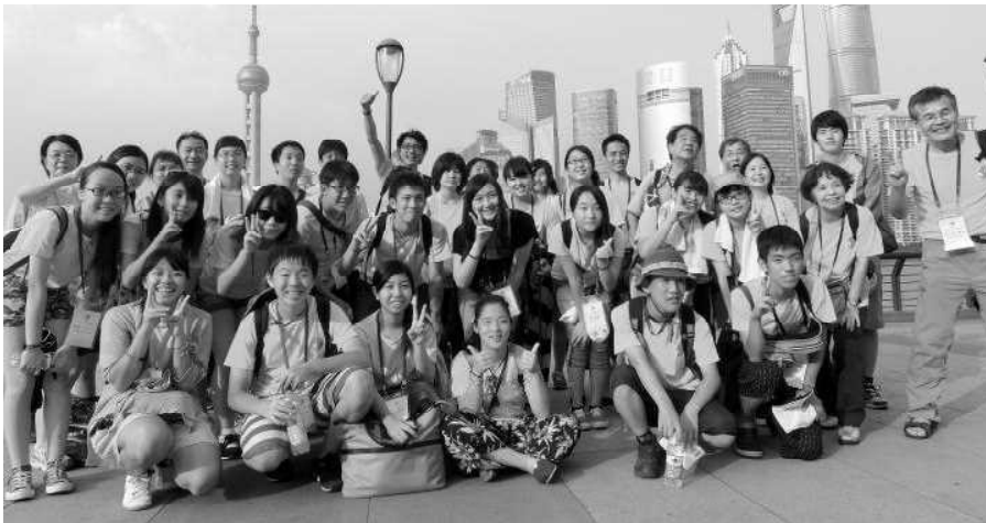
外灘（バンド）見学の日本参加者（上海キャンプ 2015/8/5）

東アジアの若者たちが 学びあい語りあい、 共に遊び、交流を深めて て友だちになる！