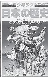
小学館発行 1998年版 (F)