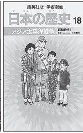
集英社発行 1998年版 (C)