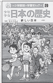
小学館発行 1983年版 (E②)