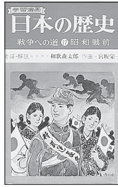
集英社発行 1968年版 (A)